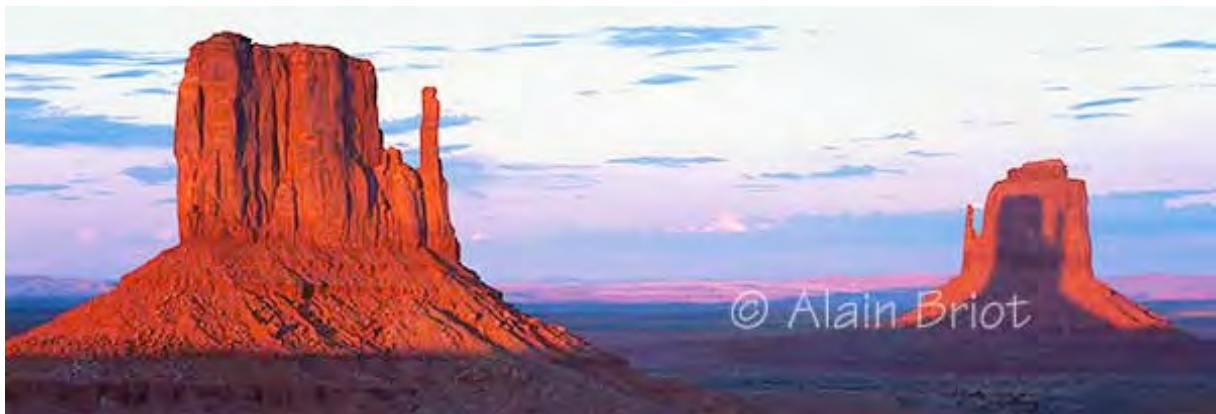
Monument Valley Shadows

Visst kan det ligga något i tanken att man inte får ställa ut för att ens konst inte är tillräckligt bra. Kanske är det så, kanske inte. Det kan finnas många skäl till att gallerier, museer och andra inte vill ställa ut ens verk. Det kan bero på att din konst inte passar in i deras profil, att de är fullbokade åratal framåt, att de bara ställer ut verk av kända konstnärer, att bilderna inte är ramade och glasade och att de inte vill kosta på det, eller på att de tror, rätt eller orätt, att konsten är osäljbar. Och så vidare. Lägg märke till att det här inte har något med konstnärliga kvaliteter att göra. Det handlar istället om den kommersiella sidan av fotografi, något som vi tar upp i nästa essä, eller med vad man menar med begreppet publik, vilket vi reder här nedan.