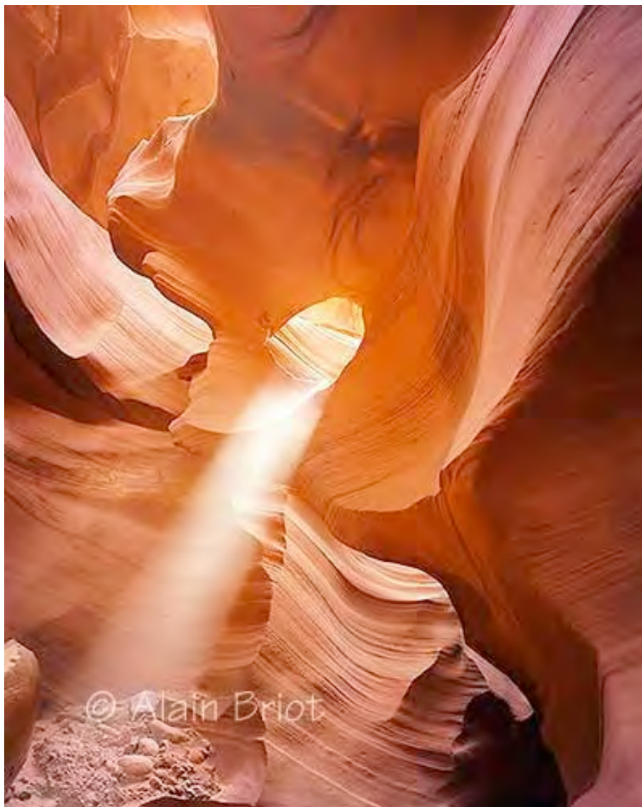
Antelope Arch Light Shaft Linhof Master Technica, Schneider 75mm, Provia 100F

drar till med förklaringen lyckliga omständigheter. Eller att framgången beror på att mina föräldrar gav mig en skyddad uppväxt och som gjorde att jag fick kunde odla mitt konstnärliga gehör. Och det är också i sin ordning med förklaringen att min framgång beror på årtal av övning för att öva upp talangen. Nå, varför svälja allt det här? Jo, därför att jag är konstnär, inte konstkritiker. Vad det ställningstagandet leder till ägnar vi nästa avsnitt åt.