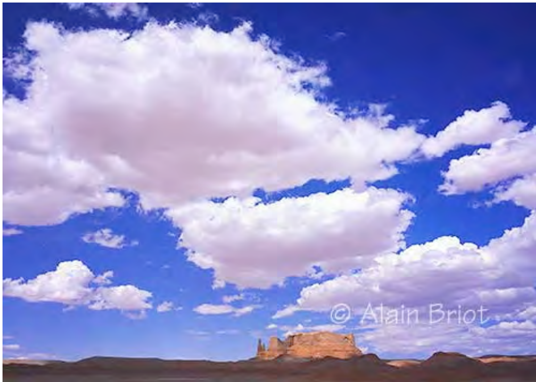
Round Rock Clouds, Navajoland Linhof Master Technika, Fuji 90mm, Provia 100F

Det är inte förmågan att sälja som definierar en som konstnär. Förmågan att sälja definierar en som affärsman. Alltför ofta kopplar man ihop de två sakerna. Säljandet har inget med konstnärskapet att göra. Det enda som har med konstnärskapet att göra är att man känner sig fri att uttrycka sin personlighet genom konsten.