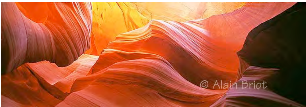
Antelope Canyon Panorama 2 Fuji 617, Fujinon 90mm, Provia 100F

Var Mozart mer talangfull än Salieri, Dali mer än Magritte, Adams mer än Weston, eller var det tvärtom? Det vet vi faktiskt inte och får aldrig veta, utan vi får nöja oss med att bara tro och tycka vad vi vill om vilka konstnärer vi uppskattar eller inte. Talang kan inte mätas. Antingen har man talang, eller inte, så enkelt är det. På det här planet blir diskussioner om talang bara ett meningsutbyte och inte en vetenskaplig diskussion.