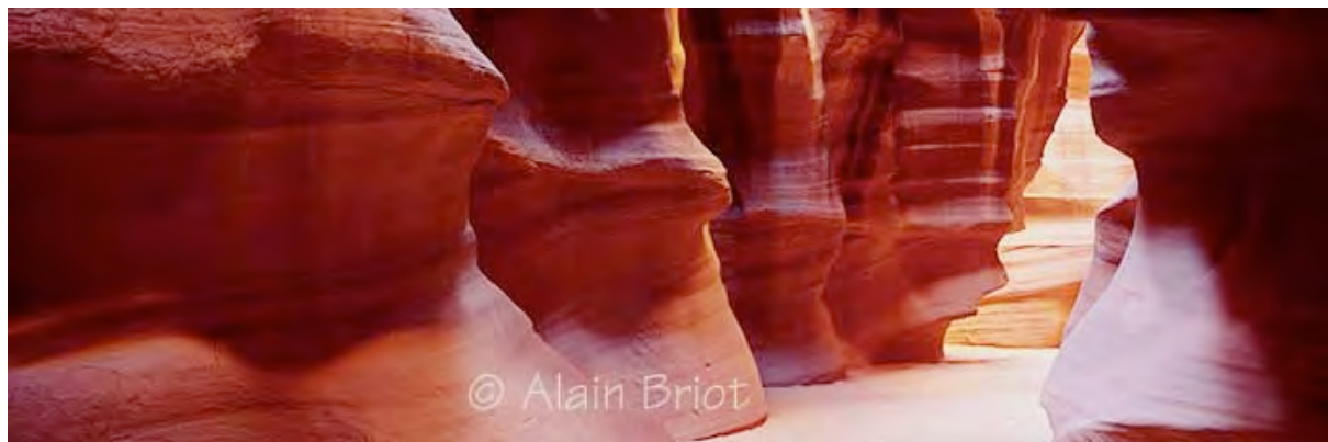
Antelope Canyon Panorama I Fuji 617, Fujinon 90 mm, Provia 100F

Nåväl, jag måste ju blir klar med essän, och därför har jag tagit mig en del friheter. Jag måste helt enkelt det för att undvika att komma med intetsägande klyschor om vad det innebär att vara konstnär. Därför säger jag klart och rakt på sak: den här essän uttrycker enbart min egen uppfattning om vad det är att vara konstnär. Du kanske tycker annorlunda. Min uppfattning är inte den enda rätta, och din kan vara precis lika giltig.