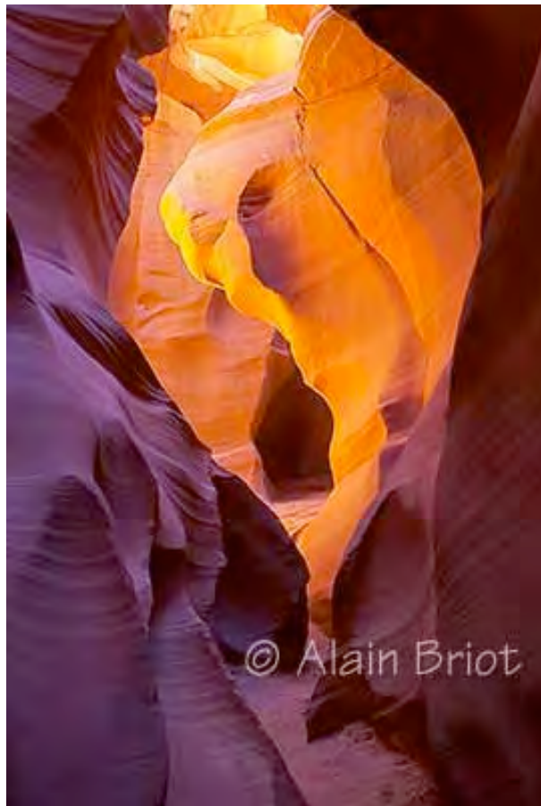
Antelope Glow Canon 300D, 17-40 F4 L

Friheten att uttrycka sig fritt är det centrala i konstnärskapet. Vi ska se vad det innebär, och hur man kan få utrymme för kreativ frihet.