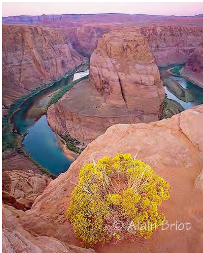
Horseshoe Bend with Flowers

Linhof Master Technica, Schneider 75mm, Provia 100F