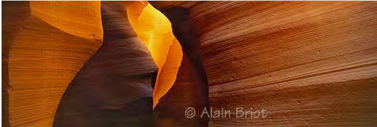
Antelope Canyon Panorama 3